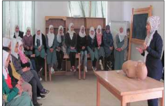
مدرسة الذهبية الشرقية الثانوية