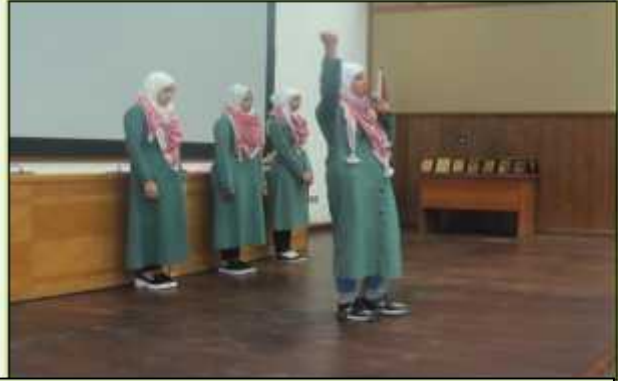
احتفال مدرسة الذهبية الشرقية الثانوية الشاملة المختلطة بمناسبة الأعياد الوطنية