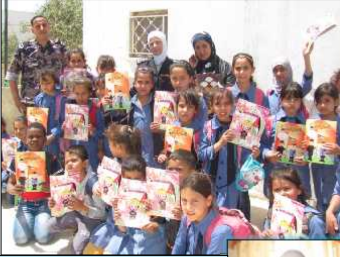
النقيرة الأساسية المختاطة