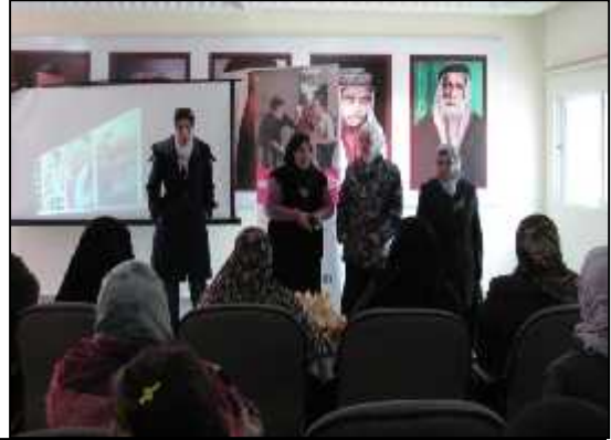
جمعية النقيرة التعاونية