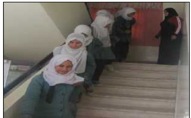
مدرسة اللسين الأساسية للبنات