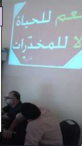
النقيرة الثانوية للبنين