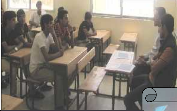
مدرسة الذهبية الغربية الثانوية للبنين