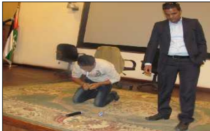
مسرحية حول المخدرات على مسرح الأكاديمية