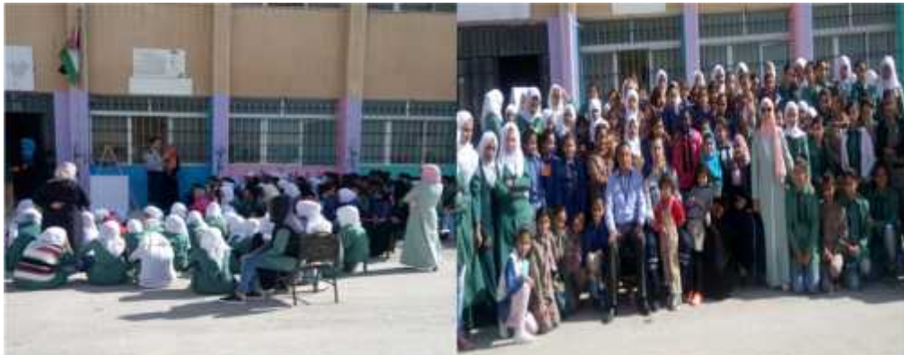
النقيرة الثانوية للبنات