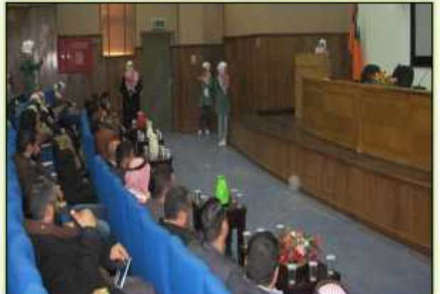
يوم وطني نظمته مدرسة الرجم الشامي الشرقي في مسرح أكاديمية