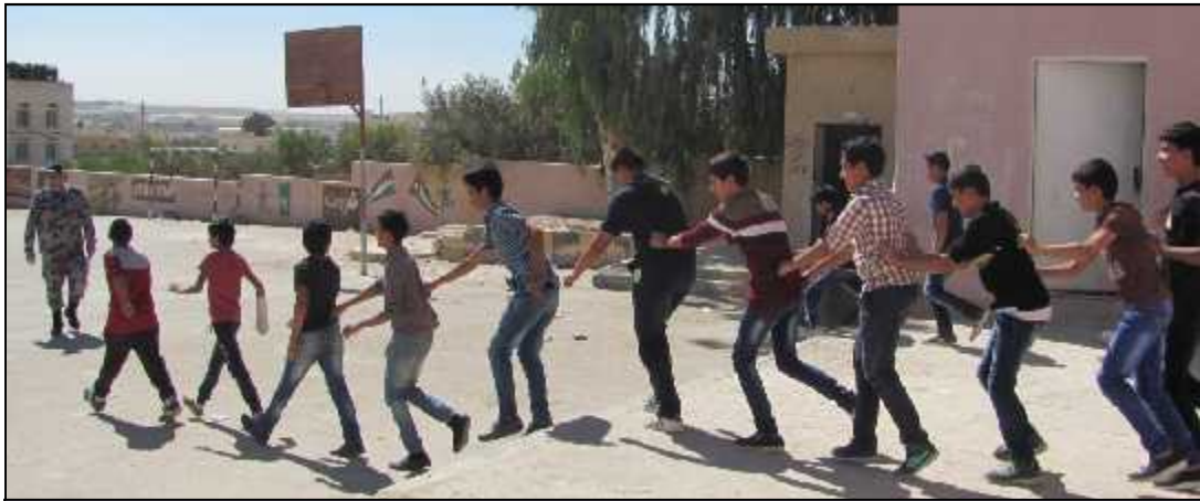
أم بطمة الثانوية للبنين