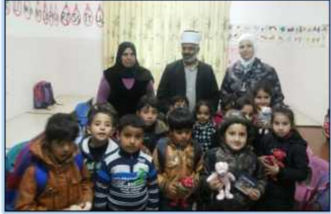
مبادرة "صحتي في غذائي"

أطلقت الأكاديمية يوم الخميس الموافق 2016/8/11م (مبادرة صحتي فيغذائي) بالتعاون مع مركز الملكة رانيا العبد الله لتكنولوجيا المعلومات في لواء الموقرو استفاد من هذه المبادرة مايقارب 150 طفل. وتأتي هذه المبادرة ضمن نشاطات المسؤولية المجتمعية في الأكاديمية وتهدف إلى توعية الأطفال بأهمية الغذاء الصحي المفيد والابتعاد عن الأغذية المصنعة والضارة وبدعم كلا من: الإدارة الملكية لحماية البيئة / مديرية الأمن العام, شركة الجنيدي للألبان, الشركة السعودية الأردنية للتنمية الصناعية(جوردينيا) وشركة الخليج للصناعات الغذائية , شركة سوا للصناعات البلاستيكية و شركة فاين للورق الصحي. وفي نهاية الفعالية كرم الدكتور فيصل الغثيان عميد الأكاديمية الجهات المختلفة الداعمة لدورهم المميز في إنجاح المبادرة.