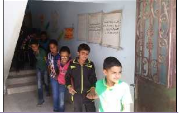
أم بطمة الأساسية للبنين