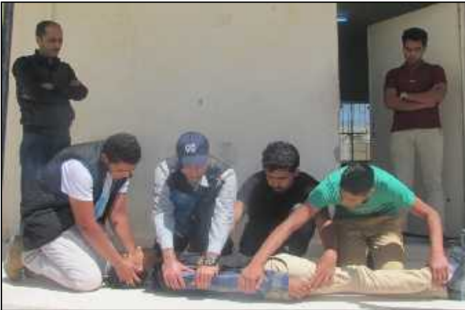
مدرسة الذهبية الغربية الثانوية للبنين