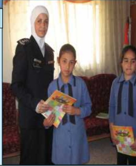
مدرسة الذهبية الشرقية الأساسية