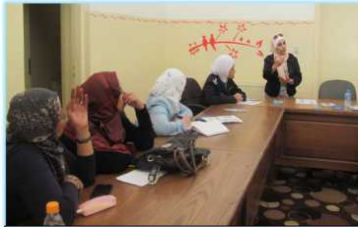
مركز الملكة رانيا العبدالله لتكنولوجيا المعلومات/الموقر