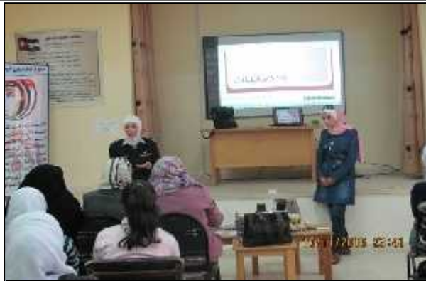
الحاتمية الثانوية للبنات