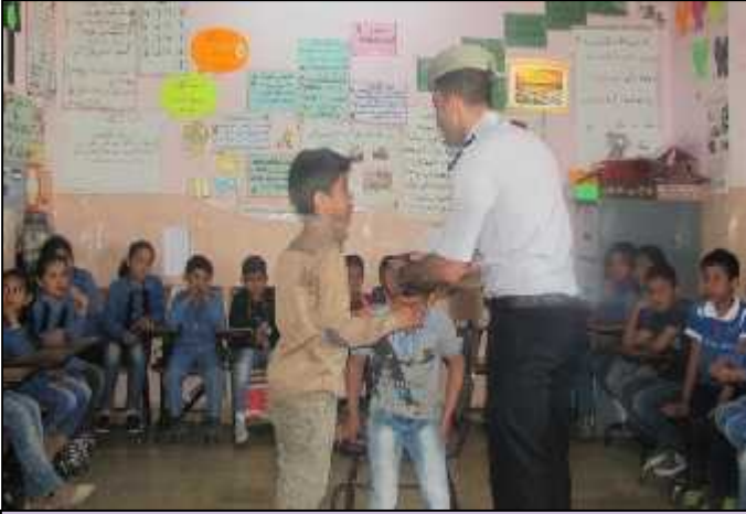
مدرسة البويضة الأساسية المختلطة الأساسية