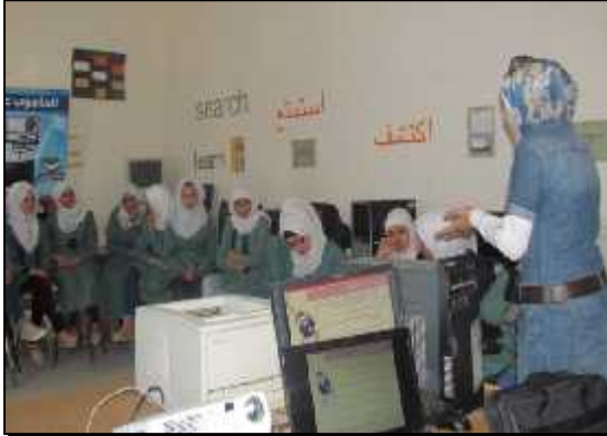
مدرسة الرجم الشامي الثانوية