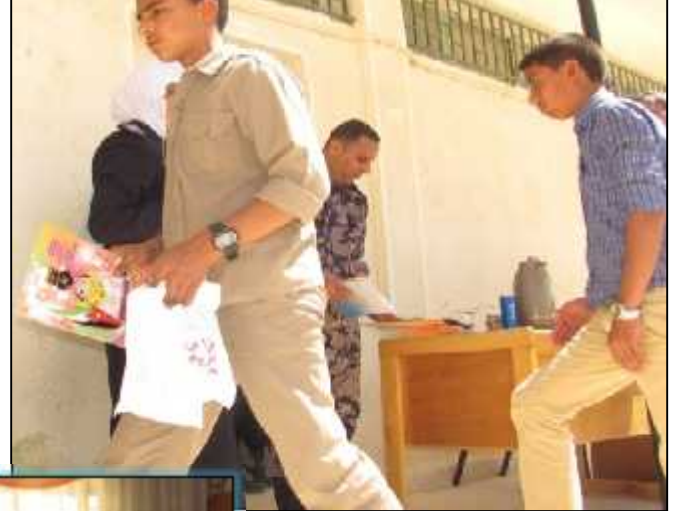
مدرسة الذهبية الغربية الأساسية