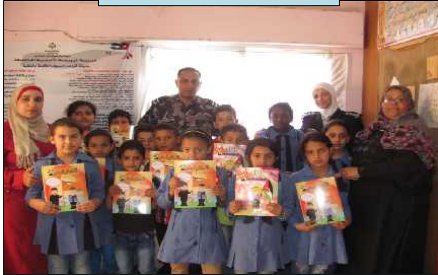
مدرسة البويضة الأساسية المختاطة