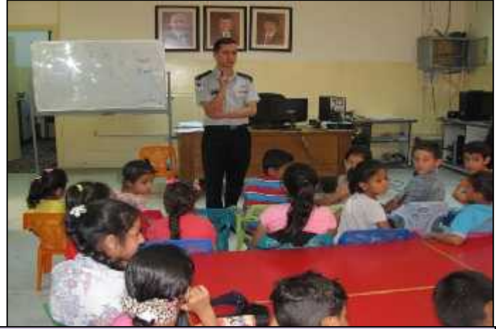
مركز الملكة رانيا العبدالله لتكنولوجيا المعلومات/الموقر