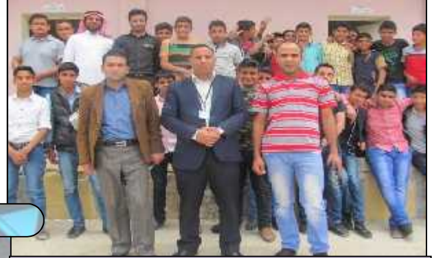
أم بطمة الثانوية للبنين